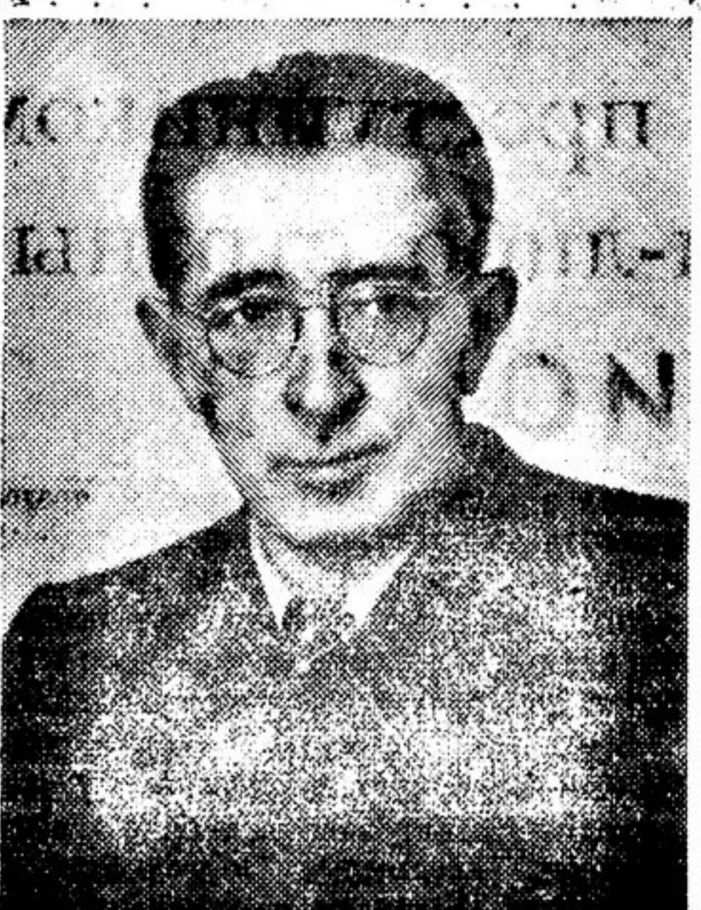
Б. А. ЛАВРЕНКО