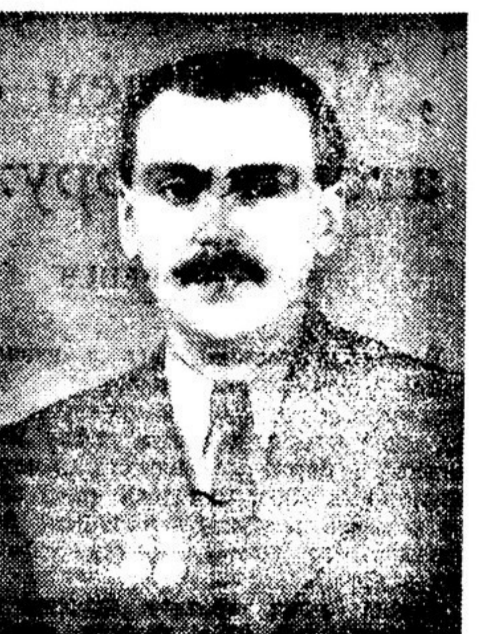
С. В. МИХАЛКОВ