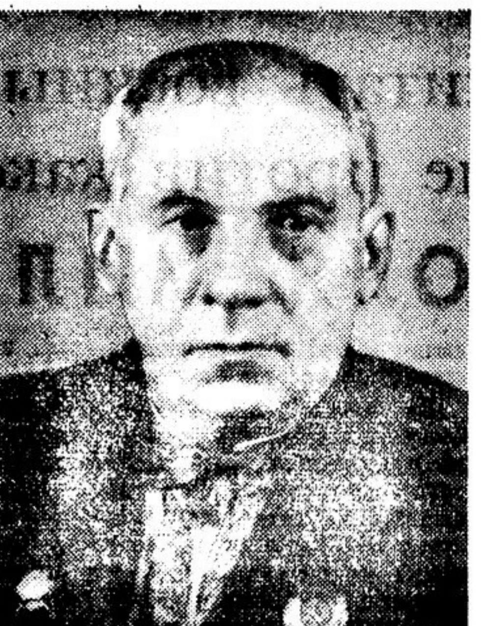
М. Ф. РЫЛЬСКИЙ